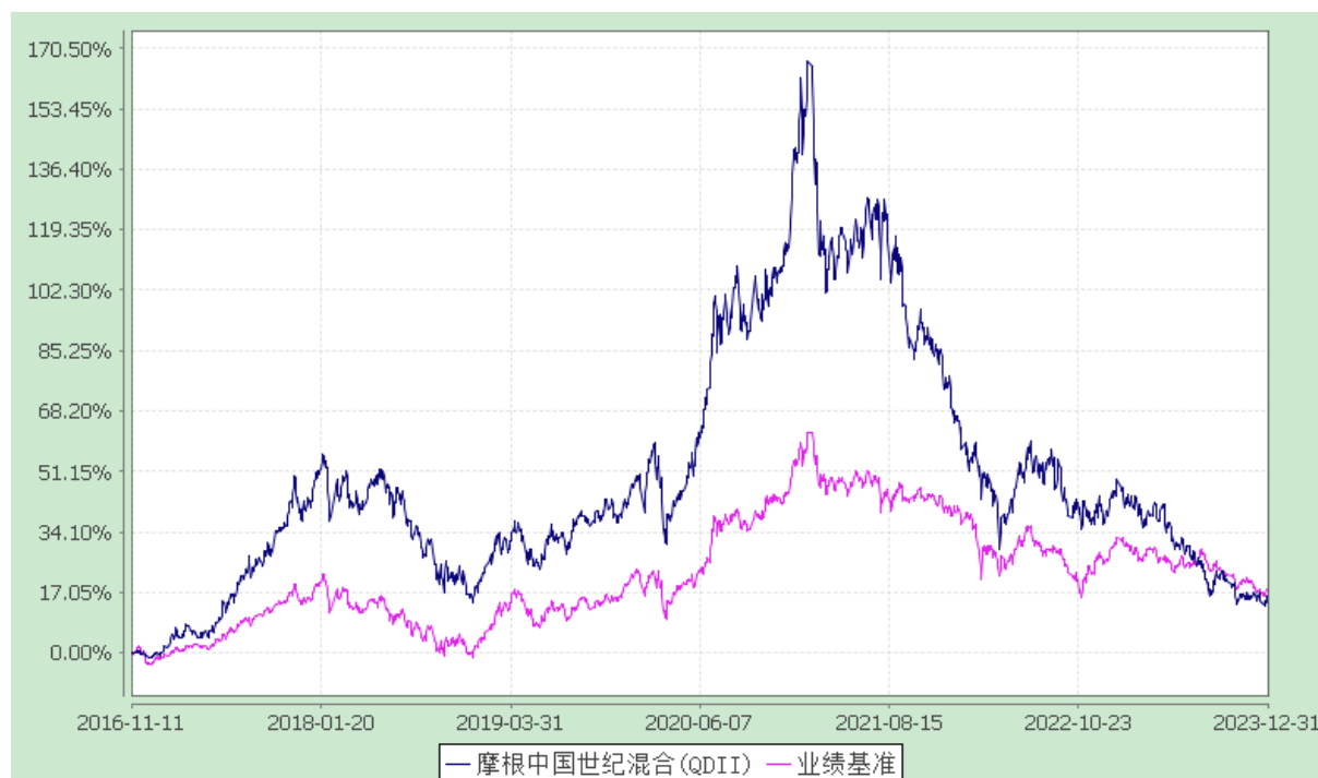
摩根中国世纪灵活配置混合型证券投资基金(QDII) 自基金合同生效以来份额累计净值增长率与业绩比较基准收益率历史走势对比图 (2016 年 11 月 11 日至 2023 年 12 月 31 日)

注：本基金合同生效日为 2016 年 11 月 11 日，图示的时间段为合同生效日至本报告期末。